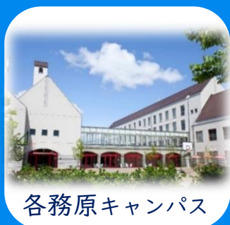
各務原キャンパス